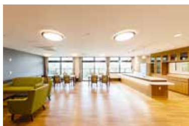
共有リビング・ダイニング