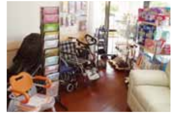
エントランス周辺