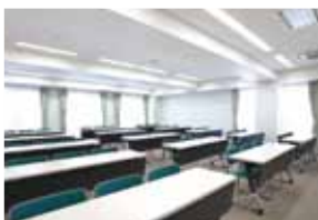
ひろがりスペース